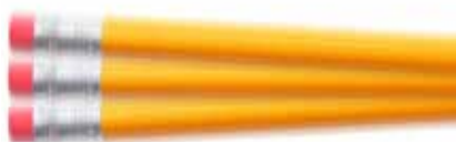
➤ Figuur 1: stroboscopisch effect op een bewegend potlood

Een tekortkoming waar veel ledlampen mee kampen is een te beperkte stabilisatie, waardoor de sinus van de netspanning terug te zien is in het licht, we spreken van flikkering. Een ander fenomeen is het